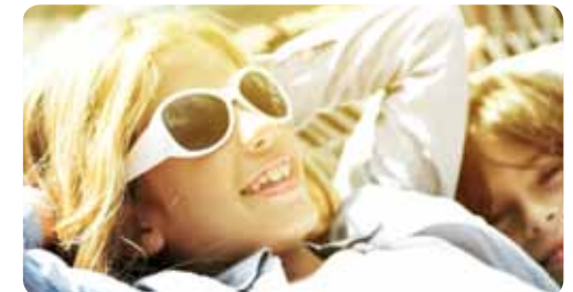
Eventuele druk- en zetfouten voorbehouden. De algemene voorwaarden zoals beschreven in deze brochure zijn geldig vanaf 1 januari 2013.

Kia Motors Nederland B.V. en de Kia-dealer of Kia-reparateur behouden zich het recht voor de voorwaarden van de door hen verleende K.I.W. tussentijds, zonder voorafkondiging, eenzijdig te wijzigen.